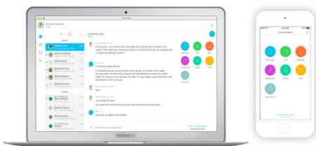
Webex Teams Apps