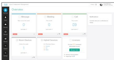
Webex Teams Admin Portal